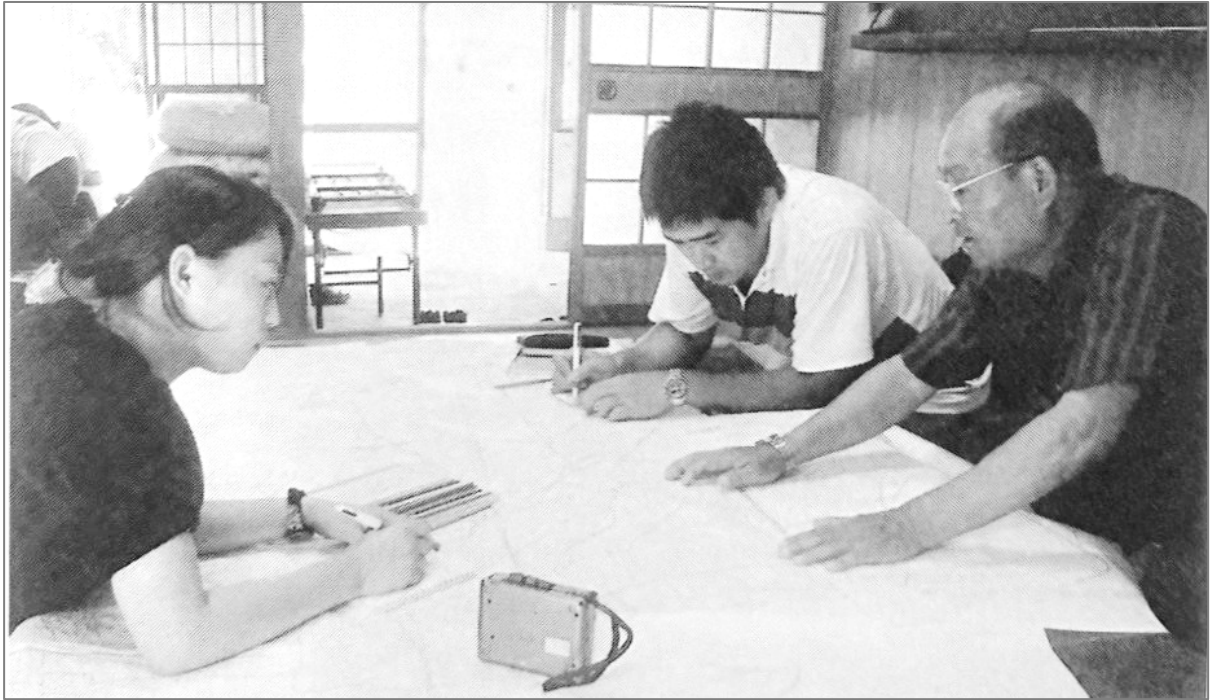
(図4:聞き取り調査の様子)

社会科では、一例としてこのような調査実習を通じ、過去から現在に至る社会のあり方、そこでの人々の生活や文化について深く学ぶことができます。