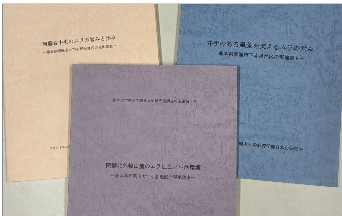
(図1:日本史研究室調査報告書の例)

これらの報告書には、参加者がその地域で丹念に調べた社会構造、産業、生活、文化などについての資料や解説が収められています。